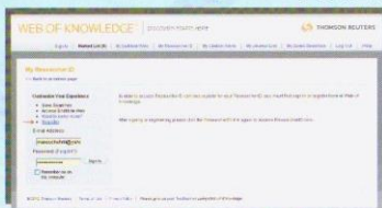
شکل ۲. صفحه اینترنتی My ResearcherID

پس از کلیک بر روی گزینه My ResearcherID در صفحه اینترنتی پایگاه تامسون رویترز، شکل ۲ را مشاهده خواهید کرد. در این مرحله با انتخاب گزینه Register می‌توانید ثبت نام کنید و از قابلیت‌های یاد شده که به طور خودکار به روز می‌شوند، استفاده نمایید.